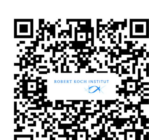
Weitere Informationen RKI